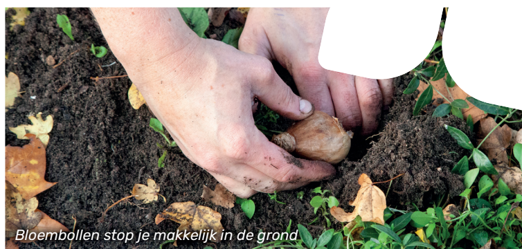
Bloembollen stop je makkelijk in de grond

Dit najaar gaan we samen zoveel mogelijk planten. Denk aan bomen, struiken, vaste planten en bollen. Want een bloeiende lente, plant je in de herfst!