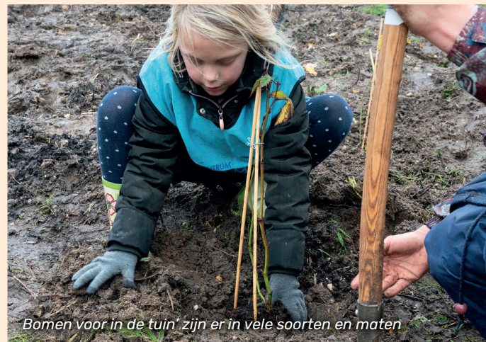
Bomen voor in de tuin, zijn er in vele soorten en maten

Het najaar is hét moment om bloembollen te planten, als je in het voorjaar wilt genieten van tulpen, narcissen en andere vroege bloeiers. Maak het jezelf eens makkelijk: plant de bollen tussen bodembedekkende vaste planten, zoals vrouwenmantel (Alchemilla) of ooievaarsbek (Geranium).