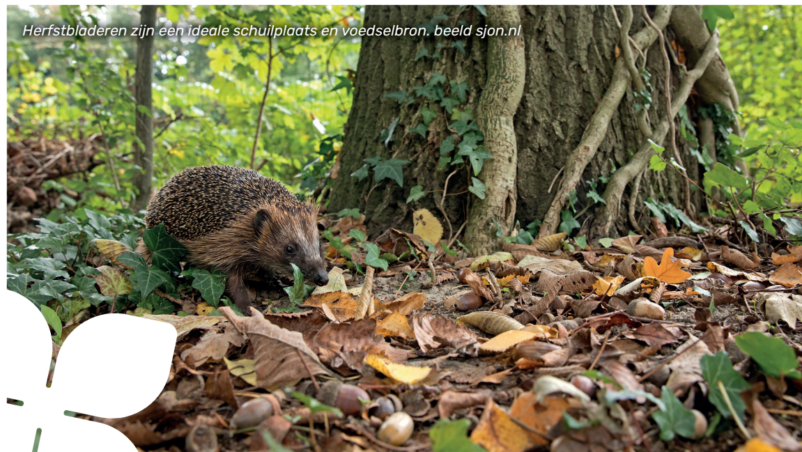
Herfstbladeren zijn een ideale schuilplaats en voedselbron.

Het najaar is het ideale seizoen voor de aanplant van bomen, struiken, vaste planten en bollen. Want door te planten in de herfst, kunnen de wortels goed aarden en geniet je in het vroege voorjaar al van een groene en bloeiende tuin. En bovendien is het fijn om lekker buiten bezig te zijn!